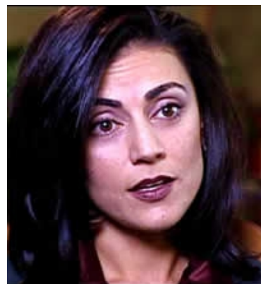
Sibel D. Edmonds

In einem persönlichen Brief an die Untersuchungskommission vom August 2004 schrieb Sibel Edmonds, "Ich erachte den Untersuchungsbericht als schwer mangelhaft in seinem Versagen auf schwerwiegende geheimdienstliche Punkte einzugehen, die mir bewusst sind, die bestätigt sind und über die ich ausgesagt habe als Zeugin in der Befragung vor der Untersuchungskommission. Deswegen muss ich annehmen, dass es andere schwerwiegende Punkte geben muss, die ich nicht kenne, die in der gleichen Weise nicht in den Untersuchungsbericht aufgenommen wurden. Diese Auslassungen werfen Zweifel auf den Wahrheitsgehalt es Kommissionsberichts und gleichzeitig auch auf seine Schlussfolgerungen und Empfehlungen." 26