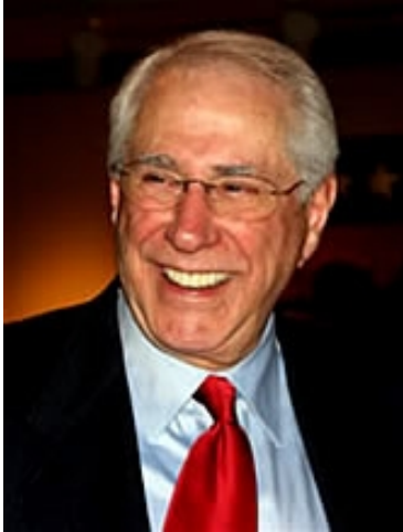
Senator Mike Gravel

Senator Gravel ist ein Mitglied der Vereinigung Political Leaders for 9/11 Truth , eine Organisation die sich folgendermaßen beschreibt: