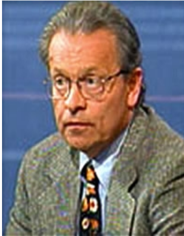
Melvin Goodman, PhD

In einer Anhörung vor dem US-Kongress im Jahre 2005 über den Untersuchungsausschuss zum 11. September sagte Goodman, “Dies ist eine wichtige Überprüfung des Untersuchungsausschusses, der eine historische Gelegenheit darstellte, die vertan wurde und über eine Kommission zum 11. September die schreckliche Fehler hatte. ...”